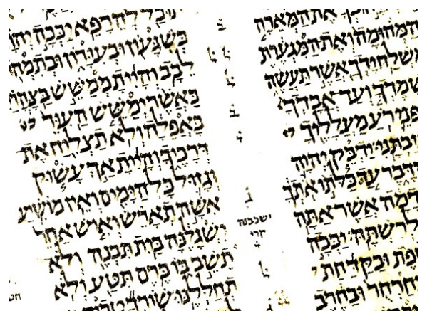
Részlet az Aleppói kódexből (Mózes 5. könyve)

Szólnunk kell még a Héber Kánon kialakulásáról. A kánon nagy része, így a Tóra (Mózes 5 könyve), a próféták könyvei, a Zsoltárok és további könyvek kanonikus voltának kérdése nem volt kérdéses, néhány tartalmilag nehéz könyv (Énekek Éneke, Prédikátor) kapcsán zajlottak viták. Ezekből a vitákból szoktak következtetni a kánon kései rögzülésére. Sokan a Kr. u. 1. századra, az úgynevezett jamniai zsinatra teszik a kánon rögzülését, ezt azonban ma a kutatók nem fogadják el, és erre jó alapjuk van, mivel egy ilyen rabbinikus gyűlésnek nem lehetett a célja a végső rögzítés, hanem sokkal inkább a kérdések megvitatása. Kérdés, hogy akkor ennél az időpontnál korábbra vagy későbbre kell-e tennünk a kánon rögződését? Egyrészt látnunk kell, hogy az első teljes héber nyelvű Biblia, amely sokkal későbből maradtunk ránk. Másrészt azonban látnunk kell, hogy a rabbinikus kor vitái is már azt jelzi, hogy mely könyveknek tulajdonítottak tekintélyt, ezek